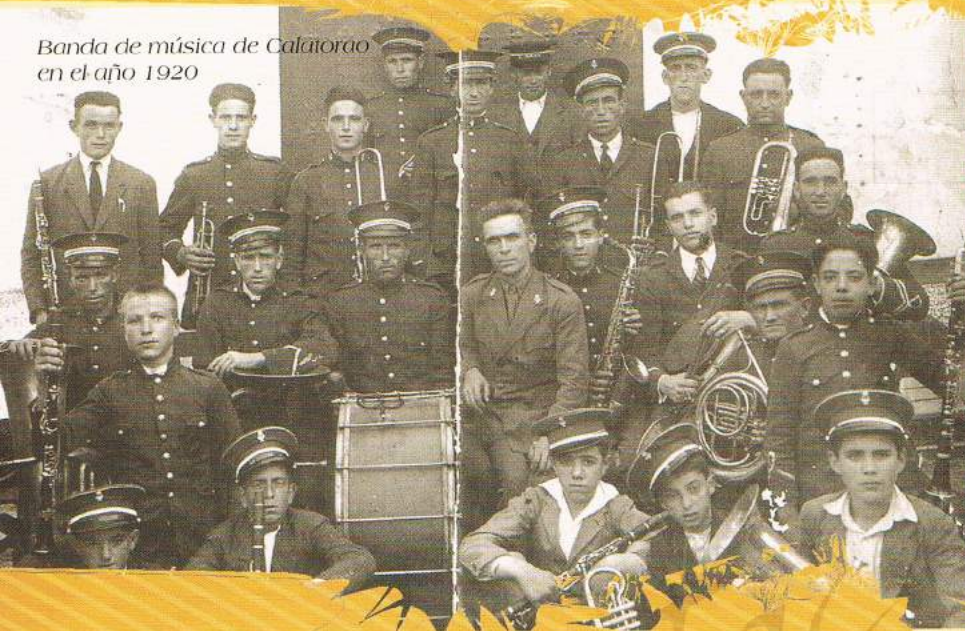
Banda de música de Calatorao en el año 1920

Como aportación más importante la Banda Municipal de Calatorao, la Asociación Musical Mariano Gracia, la Escuela de Jota de Calatorao y la Agrupación Folklórica Aragonesa Calatorao, junto a la Banda Juvenil Primitiva de Liria y el Grupo de Danzas San Frances, celebraron en Liria y Calatorao un intercambio, los años 2002 y 2003, en el que se bailaron bailes